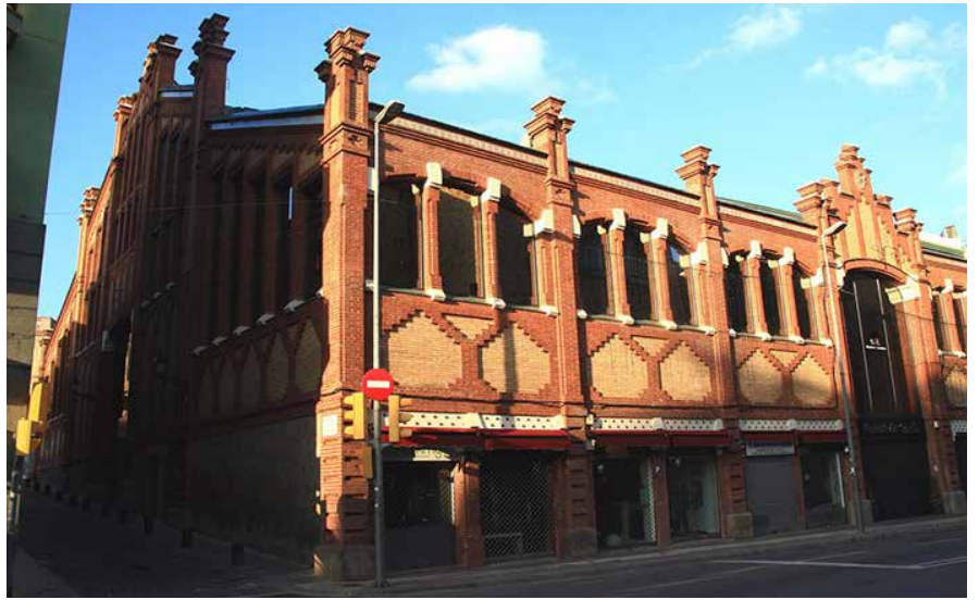
El Mercat de Sarrià.

Després de quasi un segle, l'any 2007, es va fer una profunda remodelació de l'interior i, el que és molt d'agradir, una acurada restauració de