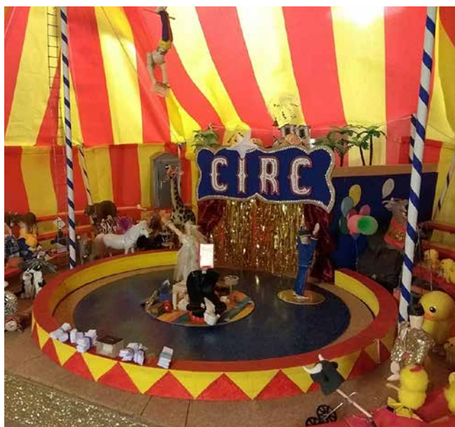
Fotografia: Olga Ricart

En una finestra ben visible des del carrer, l'escultora Olga Ricart instal·la una mena de diorama que va canviant cada dia. Cada any ha triat un tema i aquest any l'ha dedicat a l'1-O i els fets que està provocant. L'escenari era una pista de circ amb unes grades de franges grogues i vermelles. Al centre de la pista hi passaven fets que tothom pot recordar (càrregues policials, jutges jugant amb la Constitució, un frare posant pau amb una vareta màgica...). Les urnes anaven volant de la mà de trapezistes experts i com a espectadors hi havia animals d'espècies diferents (fins i tot un tiranosau amb tricor-ni), i un grup nombrós de piolins . La Candellera va plegar el pessebre, i, esperem, fins a l'any vinent!