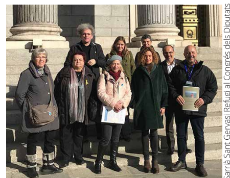
Sarrià Sant Gervasi Refugi al Congrés dels Diputats

Ja sabeu que si voleu col·laborar amb la vocalia amb aquests temes, podeu posar-vos en contacte amb nosaltres: avsarria.cat@gmail.com adreçat a la vocalia social. Ens reunim tots els últims dimecres de mes a l'Associació. Necessitem el vostre voluntariat per tal de fer en el nostre barri una xarxa on la convivència i solidaritat siguin senyal d'identitat.